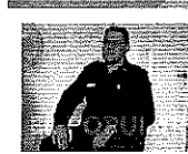
Detuvieron al ex jefe del Destacamento Vial y a otros tres policías y los investigan por